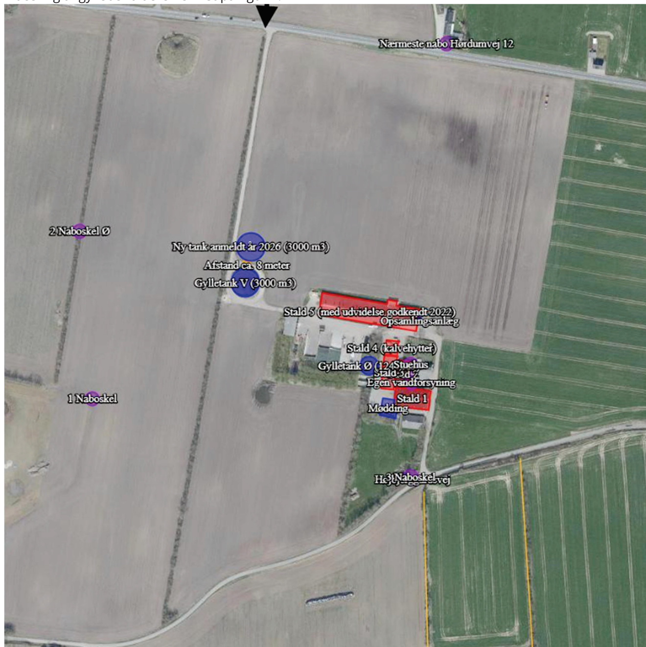
Figur 1. Placering af ny gyllebeholder

Placering af gyllebeholderen er vist på figur 1.